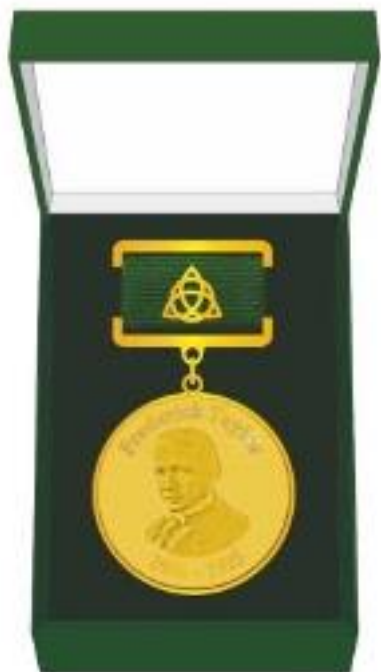
Золотая медаль им. Ф. Тейлора «За заслуги в развитии управленческой мысли»