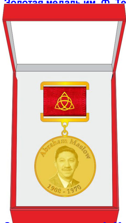
Золотая медаль им. А. Маслоу «За вклад в развитие гуманитарных наук»