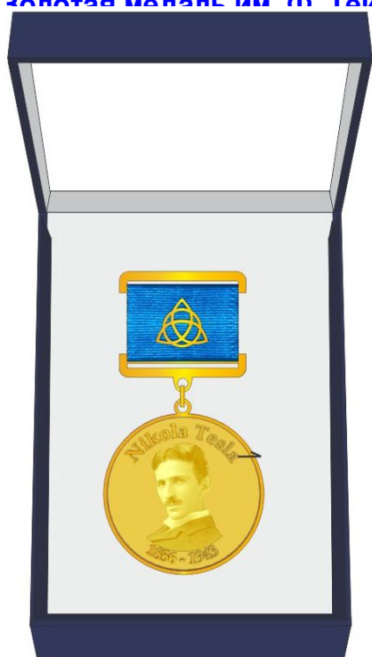
Золотая медаль им. Н. Тесла «За вклад в развитие техники и технологии»