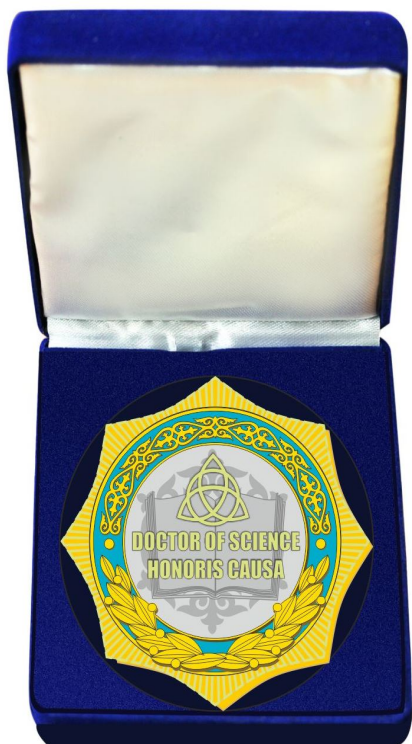
Нагрудный знак «Почетный доктор наук (Doctor of Science, Honoris Causa)»