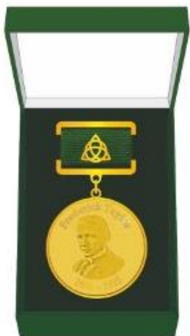
Золотая медаль им. Ф. Тейлора «За заслуги в развитии управленческой мысли»