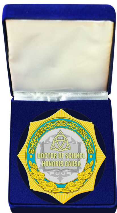
Нагрудный знак «Почетный доктор наук (Doctor of Science, Honoris Causa)»